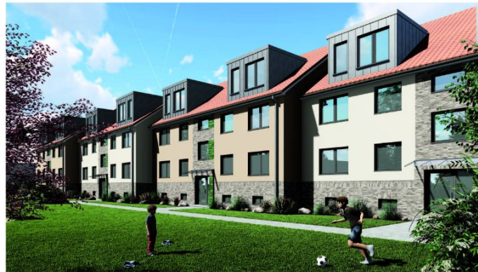
Variante 2.5, Gartenansicht